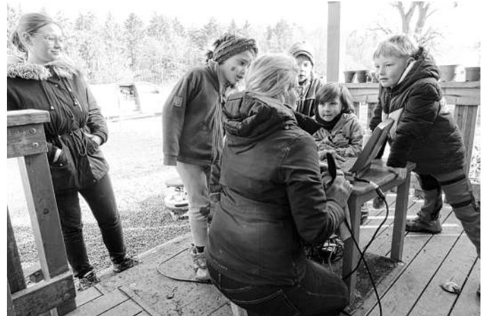
Die Tierärztin zeigt ihr Ultraschallgerät.

Wir möchten Sie herzlich zu unserem Zeller Nachmittag der Kinderbetreuungseinrichtungen am 12. Mai 2026 einladen. Unseren Naturkindergarten können sie an diesen Tag kennenlernen. Es findet eine Führung von 16.30 – 17.30 Uhr statt. Wir bitten um Anmeldung bis spätestens 6. Mai 2026 unter hauptamt@zell-u-a.de oder per Telefon 0716480724.