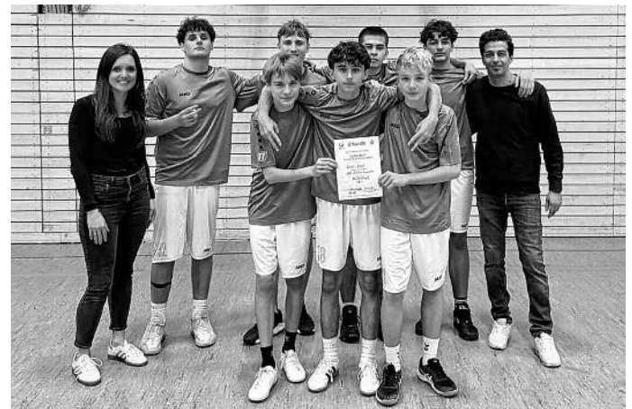
Das Team

Zum ersten Mal nahm die Albert-Schweitzer-Schule Albershausen mit einer Jungenmannschaft der Altersklasse U16 am Wettbewerb Jugend trainiert für Olympia im Basketball teil. Für das Turnier stand eine weite Anreise nach Crailsheim auf dem Programm.