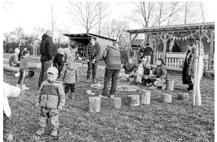
Grillen am Lagerfeuer

Der Abend hat einmal mehr gezeigt, wie wichtig Gemeinschaft, gegenseitige Unterstützung und Vertrauen sind. Werte, die den Naturkindergarten auch in Zukunft tragen werden.