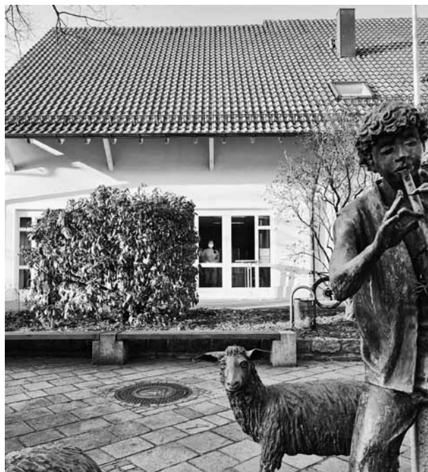
Gratis-Corona-Schnelltest-Station Lindenstraße 4

Sie können ohne Terminvergabe direkt dort erscheinen. Das Ergebnis erhalten Sie nach ca. 15 Minuten. Sollte dieses negativ sein, heißt dies, dass Sie am Tag des Tests mit hoher Wahrscheinlichkeit nicht ansteckend sind und Sie somit die Gemeinschaft vor einer möglichen Infektion schützen.