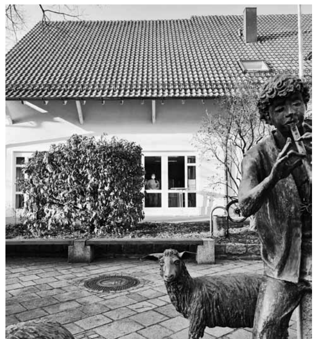
Gratis-Corona-Schnelltest-Station Lindenstraße 4

Das Ergebnis erhalten Sie nach ca. 15 Minuten. Sollte dieses negativ sein, heißt dies, dass Sie am Tag des Tests mit hoher Wahrscheinlichkeit nicht ansteckend sind und Sie somit die Gemeinschaft vor einer möglichen Infektion schützen.