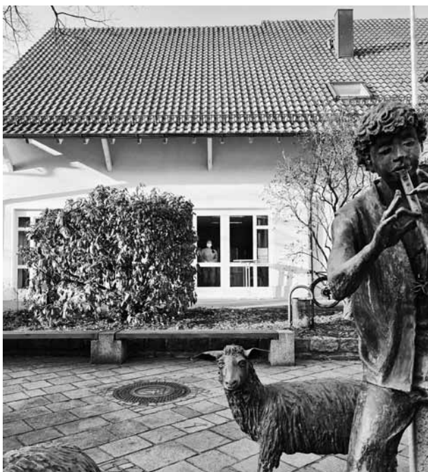
Gratis-Corona-Schnelltest-Station Lindenstraße 4

Das Ergebnis erhalten Sie nach ca. 15 Minuten. Sollte dieses negativ sein, heißt dies, dass Sie am Tag des Tests mit hoher Wahrscheinlichkeit nicht ansteckend sind und Sie somit die Gemeinschaft vor einer möglichen Infektion schützen.