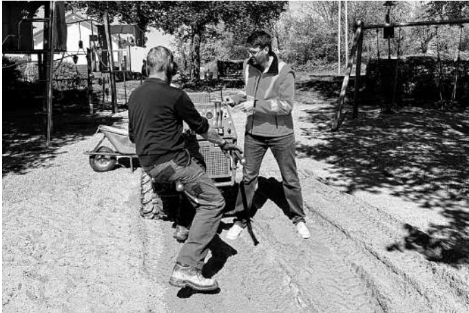
BM Flik (rechts) versucht sich unter professioneller Anleitung an der Sandreinigung.

der Firma Sandmaster durchgeführt wurden, wurde der Sand professionell aufgearbeitet, sodass der Spielplatz nun in neuem Glanz erstrahlen kann. Gleichzeitig ist in diesem Zug der Fallschutz unter den Spielgeräten wieder vollständig hergestellt.