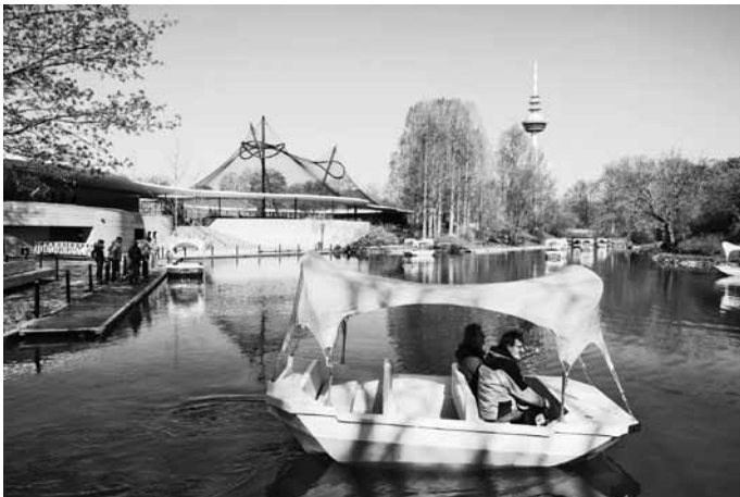
Jetzt schon anmelden für den Tagesausflug zur BUGA.