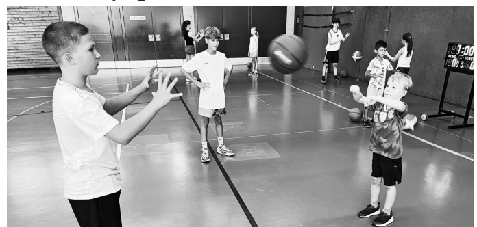
Die U14-Spielerinnen und Spieler erklärten unter anderem, wie man richtig passt.

Acht Kinder im Alter zwischen sechs und elf Jahren haben am vergangenen Freitag an einem Schnupperkurs der TSG-Basketballabteilung teilgenommen. Im Rahmen des Schülerferienprogramms