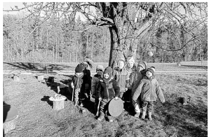
Dokumentation des Experiments

Die Butzbachzwerge haben sich die Forscherfrage gestellt: Wie entsteht Eis? Diese Frage kam während unseren Exkursionen auf, als die Pfützen zugefroren waren. Im alltäglichen Kindertreff wurden bei -8 Grad, Becher mit eingefärbten Wasser befüllt. Dann wurde das Wasser mit einem Wollfaden versehen. Jetzt brauchte das Forscherteam viel Geduld. Nach unserer Exkursion konnten die Kinder erste Wasserkristalle auf der Oberfläche der einzelnen Becher erkennen. Diese Kristalle wuchsen bis zur Abholzeit zusammen und bildeten eine feste Oberfläche auf dem Wasser. Damit Wasser zu Eis werden kann, muss es sehr kalt sein. Die Temperatur muss unter 0 Grad Celsius fallen. Zu diesem Ergebnis kamen die Kinder. Bis zum nächsten Tag hat sich der Gefrierprozess fortgesetzt. Wenn die Eiskristalle einmal angefangen haben, sich zu bilden, friert nach und nach mehr Wasser. Zuerst bildet sich eine dünne Schicht Eis, und dann wird diese Schicht dicker und dicker, je länger es kalt bleibt.